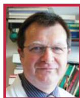
Frédéric GALACTEROS MÉDECIN, CHERCHEUR France